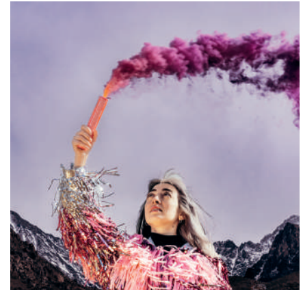
PORTAL | Single