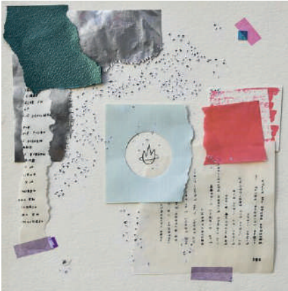
OTRO UNIVERSO | Single