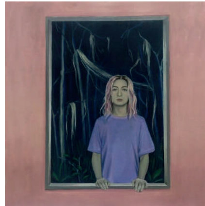
EN LO INSONDABLE EL VELO SE ROMPE | Album